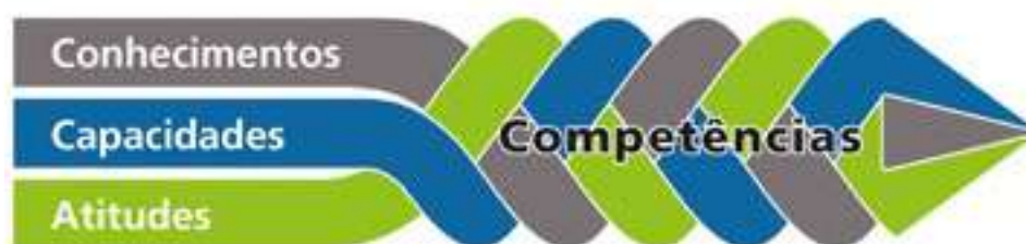
Figura 2 – Esquema conceitual de competência adaptado de “The Future of Education and Skills: OECD Education 2030 Framework”, In: Global competency for an inclusive world , OECD, 2016.

As competências são combinações complexas de conhecimentos, capacidades e atitudes, são centrais no perfil dos alunos, na escolaridade obrigatória. A Figura 2 ilustra este conceito salientando a interligação das três dimensões.